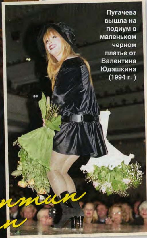
Пугачева вышла на подиум в маленьком черном платье от Валентина Юдашкина (1994 г.)

И сегодня Примадонна не перестает удивлять. Например, на премьеру фильма «Любовь с акцентом» она пришла в лосинах, тунике и косухе — образе, который для нее