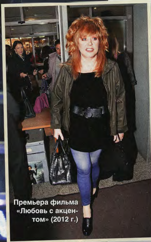
Премьера фильма «Любовь с акцентом» (2012 г.)